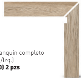
9x45 Zanquín completo [Dcha. /Izq.] (M-750) 2 pzs