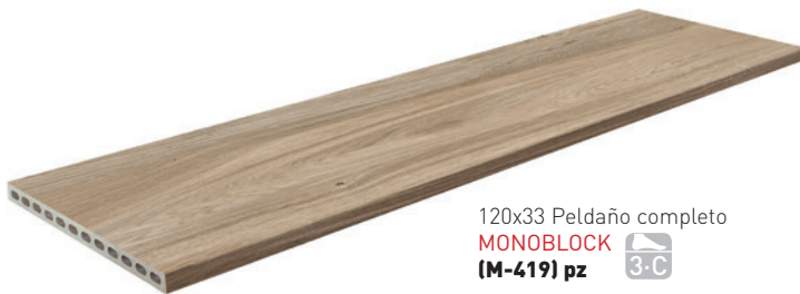
120x33 Peldaño completo MONOBLOCK (M-419) pz